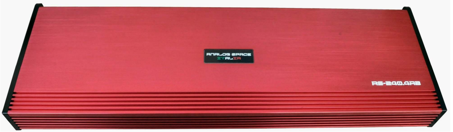
Foto AS-240.4AB Classe AB