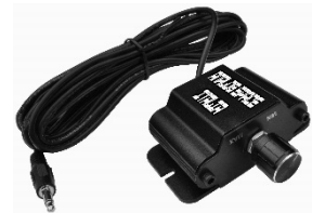
Foto AS-5500.1D-FR Classe D ed AS-8500.1D-FR Classe D